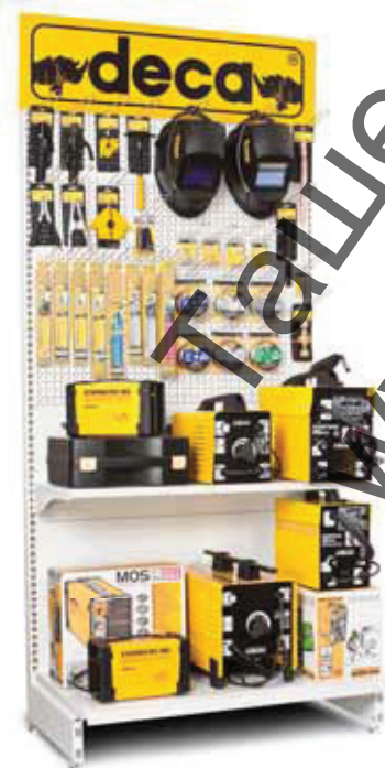
019001 Blister Display Concept 100 x 50 x 201,5 cm

Exposing the product These products are in display pack