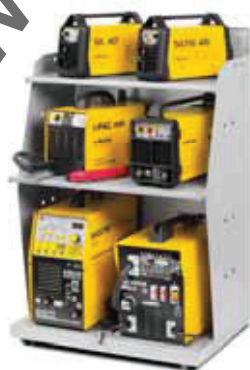
019004 Displayer Concept 66 x 47 x 102 cm 3 ripiani - 3 shelves